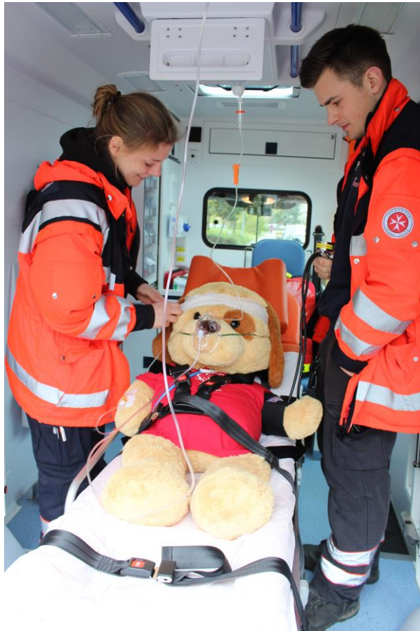
Besichtigung eines RTW