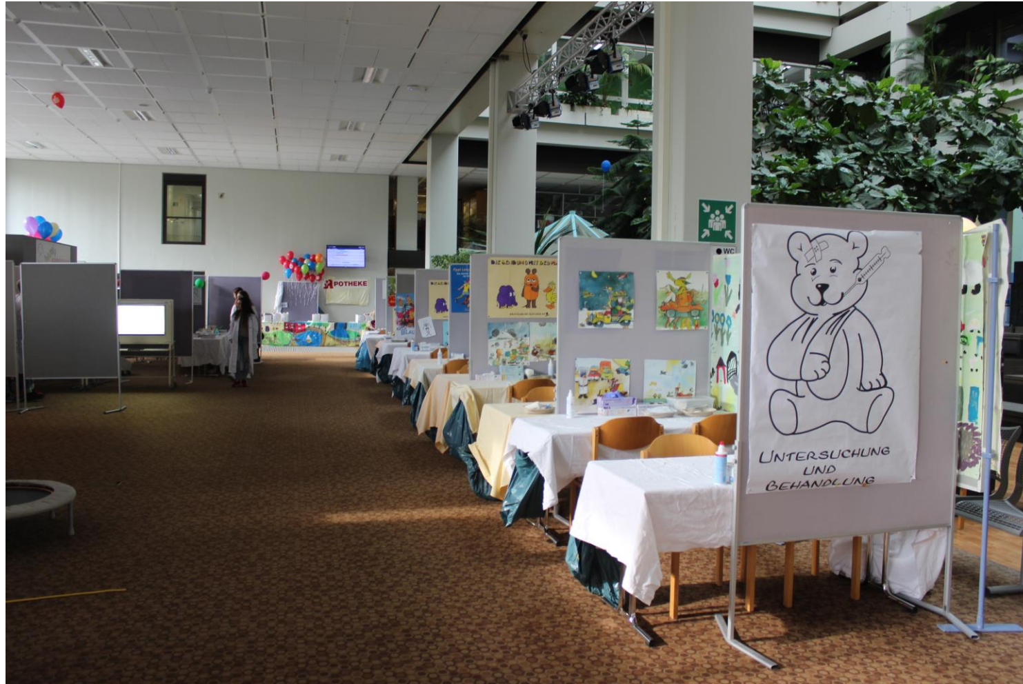
Osthalle des Klinikums